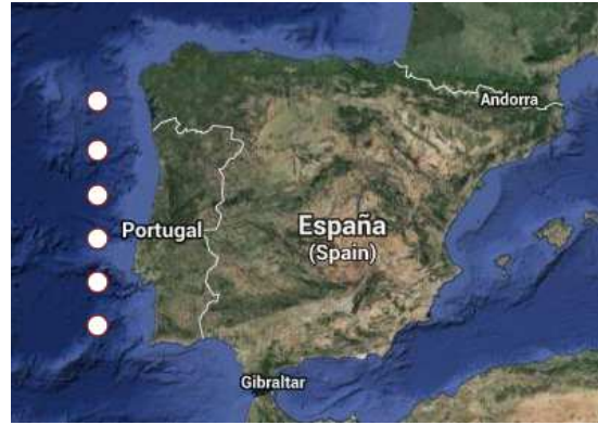
Fig.3. Pontos nos que se calculou o índice de afloramento

O arquivo “UI_PFEL_82_11.xls” contém valores mensuais do índice de upwelling calculado para seis pontos situados ó longo da costa oeste da Península Ibérica. Pídesse promediar os valores para toda a zona e calcular o ano perpetuo para a serie resultante.