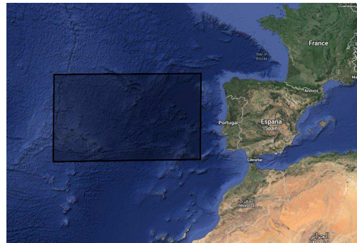
Fig.1. Área da que se obtiveron os datos de SST.

A partir dos datos anuais de temperatura superficial do mar (SST), incluídos no arquivo “ERSST_1900_2011.xls”. Pídese representar a serie de SST para todo o período (1900-2011) e para os subperíodos 1900-1938, 1939-1972, 1973-2011. Ademais, calcular cal foi a tendencia (°C por década) en cada un dos catro casos. Comentar os resultados.