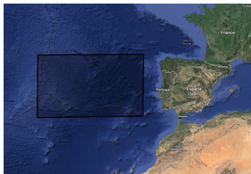
Fig.1. Área de la que se obtuvieron los datos de SST.

A partir de los datos anuales de temperatura superficial del mar (SST), incluidos en el archivo “ERSST_1900_2011.xls”. Se pide representar la serie de SST para todo el período (1900-2011) y para los subperíodos 1900-1938, 1939-1972, 1973-2011. Además, calcular cual fue la tendencia en cada uno de los cuatro casos. Comentar los resultados.