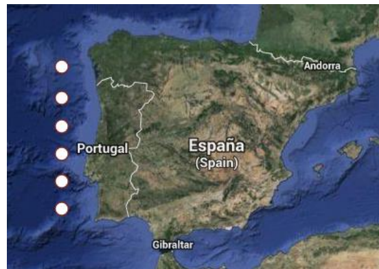
Fig.3. Puntos nos que se calculou o índice de afloramento

El archivo “UI_PFEL_82_11.xls” contiene valores mensuales del índice de upwelling calculado para seis puntos situados a lo largo de la costa oeste de la Península Ibérica. Se pide promediar los valores para toda la zona y calcular el año perpetuo para la serie resultante.